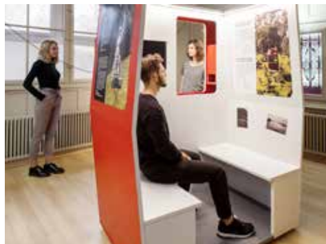
Exposition «Le bonheur – par les airs – par le câble».

En 2017, quelque 5000 personnes ont visité la Maison du patrimoine (7400 l'année précédente). Ce chiffre comprend 3400 entrées aux expositions et 1600 aux manifestations. En outre, 550 personnes ont participé aux visites et aux ateliers hors de la Villa Patumbah. Les sept tours de ville présentant le point de vue d'un réfugié ont remporté un grand succès avec plus de 70 personnes en moyenne. Le recul des entrées peut être attribué à l'exposition «Shelter», dont le thème était éloigné du patrimoine, et à la réduction de la publicité pour des raisons budgétaires. Si l'on ajoute cependant les activités extramuros et l'exposition sur le Val Bavona qui a attiré plus de 5700 visiteurs à Bellinzone, le nombre de personnes atteintes dépasse largement celui de l'année précédente. Le nombre d'enfants et d'adolescents reste stable aux alentours du millier. Au total et en comptant les visites théâtrales, 78 visites publiques et 56 privées ont été organisées pour les adultes ainsi que 43 ateliers pour les classes – outre des élèves de la ville et du canton de Zurich, la Mai-