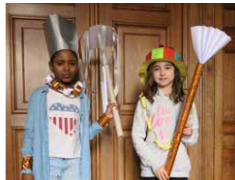
Atelier «Tableau vivant»

L'exploitation de la Maison du patrimoine bénéficie d'un appui conséquent de l'Office fédéral de la culture dans le cadre du Message culture. Le Club des amis de la Villa Patumbah constitue une autre source de financement. Le soutien de l'association Architecture for Refugees à l'exposition «Shelter» s'est concrétisé par de nombreuses heures de bénévolat. Quant à la trilogie «Le bonheur – par les airs – par le câble», elle a reçu l'appui de l'Office fédéral de la culture et du Département des finances de la Ville de Zurich. Enfin, le «Dschungel-Tour» est soutenu par les fondations Ernst Göhner, Gottfried et Ursula Schächli-Jecklin, Jürg George Bürki, et par le Pour-cent culturel Migros.