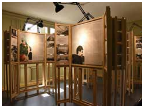
Exposition «Shelter is not enough»

son du patrimoine a accueilli des classes d'Argovie, de Berne, de Bâle-Ville, de Glaris et de Schwytz. Douze après-midis pour les enfants et les familles ont eu lieu, auxquels sont venues s'ajouter quatre animations d'un jour pendant les vacances.