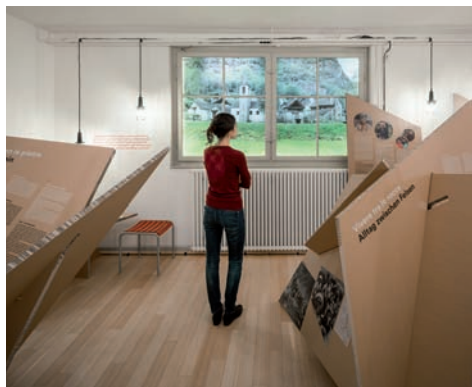
Exposition «Le Val Bavona – une vallée tessinoise à nulle autre pareille».