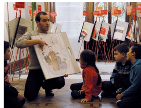
Une classe participe à l'atelier sur le thème «Habiter».

Le fonctionnement de la Maison du patrimoine est assuré par Patrimoine suisse. Ce dernier loue la Villa Patumbah à la Fondation Patumbah. L'Office fédéral de la culture apporte un appui conséquent dans le cadre du Message culture. Le Club des amis de la Villa Patumbah constitue une autre source de financement: les membres du Club soutiennent l'exploitation par une cotisation annuelle de 1000 francs et bénéficient en échange de diverses offres. L'exposition «Val Bavona» a reçu l'appui des fondations Ernst Göhner et Binding, de Pro Helvetia et du Fonds Suisse pour le Paysage. D'autres partenaires privés et publics sont recherchés afin de garantir à long terme les activités de médiation et l'exploitation.