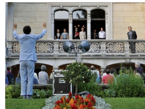
Parcours théâtral «Sturm in Patumbah».