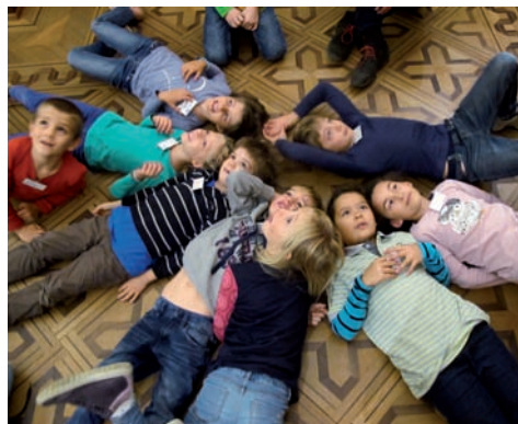
Atelier «Patumbah Ahoi» durant les vacances.